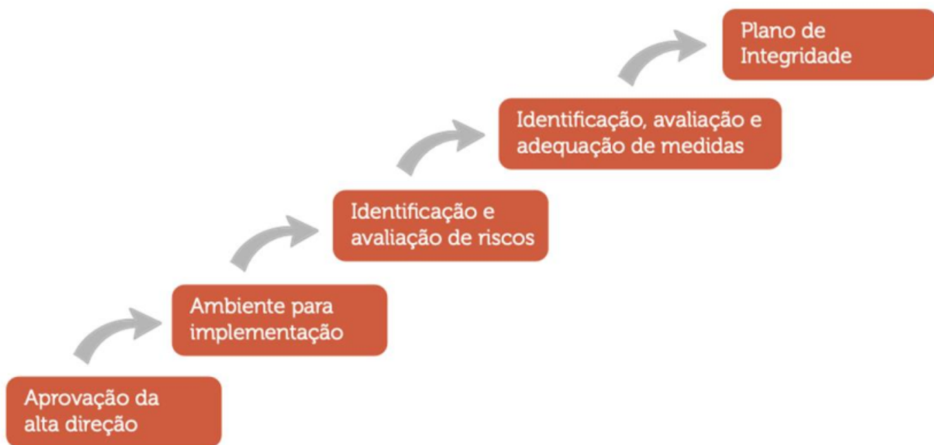
Figura 2 - Etapas para elaboração do Plano de Integridade