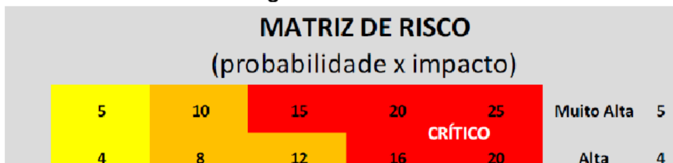
Figura 1 – Matriz de Risco

Para estabelecer parâmetros claros, os níveis de probabilidade e impacto são classificados em cinco categorias: muito baixo, baixo, médio, alto e muito alto. A multiplicação da classificação da probabilidade com o seu impacto gera o resultado de risco, que pode ser classificado como pequeno, moderado, alto ou crítico, de acordo com a matriz de risco apresentada abaixo.